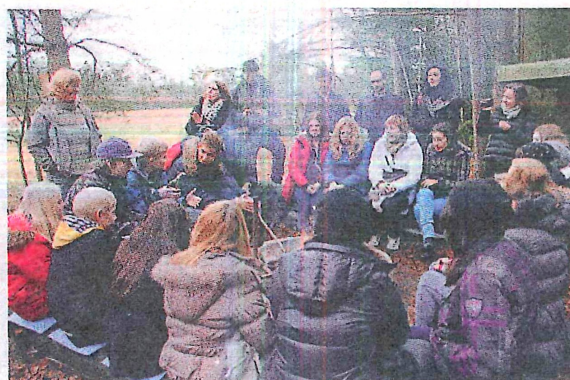
I torsdags åkte sällskapet på utflykt till Hillet i Naum. Runt brasan bjöd varje deltagarland bland annat på en liten sångtrudelutt från hemlandet.

-Som svensk- och engelskalärare ser jag ju att ungdomarna också lär sig en hel del ur ett språkperspektiv. Generellt sett är våra svenska ungdomar väldigt duktiga på engel-